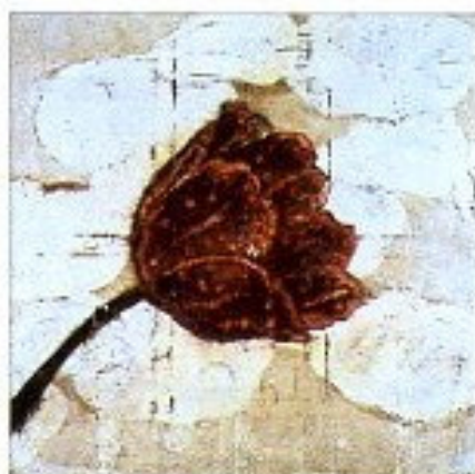
"Botanique", 150 x 150 cm, 2003

Cette exposition au Musée de Cognac précède celle d'Orléans et fait suite aux Musées de Gaillac, d'Aix-les-Bains et Art Sénat, à Paris. On y retrouve une écriture très différente des peintures de rêves aux personnages parsemés sur la toile enduite et pré-collée de papiers. Ainsi une manière de rugosité s'impose-t-elle sur le support devenu vibrant, animant le récit que le peintre compose ensuite. Aujourd'hui ce sont de gros motifs botaniques, ou encore des baigneuses émergeant des flots, qui occupent largement l'espace de la toile. Les couleurs restent fidèles à la palette de l'artiste: des rouges singuliers, des couleurs d'ocre et de sable, de beaux bleus pour l'eau et le ciel. Cette peinture est peut-être celle de la quiétude, du repos et du silence, à moins que ce ne soit celle du drame latent...Symboliste, réaliste, post-impressionniste, autant de vocables possibles, d'étiquettes qui pourraient valser peut-être devant nos yeux, mais, vraiment, sans aucune nécessité! Dans sa préface au catalogue on le voit comme "rousseauiste" (?)...Voilà! Mais, quoi qu'il en soit, à voir absolument!